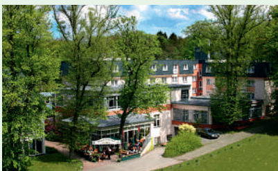
Ihr 4-Sterne-superior TRIHOTEL am Schweizer Wald

Die 101 Zimmer sind sehr geschmackvoll eingerichtet und mit Dusche/WC, Haartrockner, Telefon, TV (kostenlose SKY Programme), Radio,