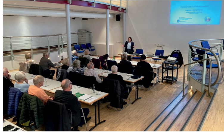
Sehr informativ: Die Senioren im BV Aus- und Fortbildung befassten sich im November mit den Themen Hospizarbeit und Palliativmedizin.

Beispielhaft für die Auseinandersetzung mit Themen auch jenseits der Arbeitswelt nennt Linnenbrink eine Veranstaltung der Senioren im BV Aus- und Fortbildung, bei der es Ende November um Hospizarbeit und Palliativmedizin ging. Über Sterben und Tod sprechen viele Menschen nicht gern, trotzdem geht es jeden an. „Auf der Veranstaltung gab es viele Informationen und prakti-